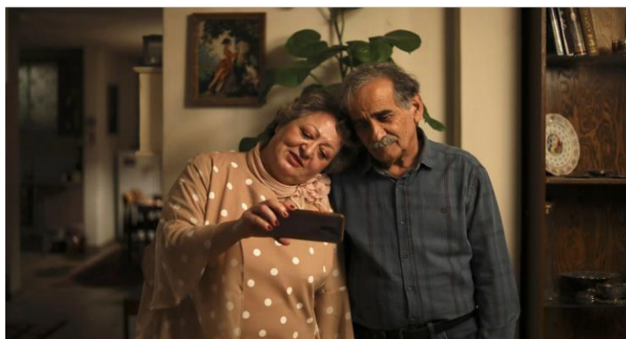
Photo du film Mon Gâteau préféré, Maryam Moghadam et Behtash Sanaeaha, 2024

Ce cours s'inscrit dans la continuité des deux années précédentes (2023-2024 / 2024-2025). Nous poursuivrons notre exploration de la société iranienne contemporaine à travers une nouvelle sélection d'œuvres cinématographiques. L'objectif est d'approfondir notre compréhension des dynamiques sociales, culturelles et politiques de l'Iran, en mettant en lumière des aspects méconnus ou invisibilisés de cette société.